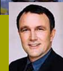
Dr. Michael Lüders

Humboldt Institut für Internet und Gesellschaft