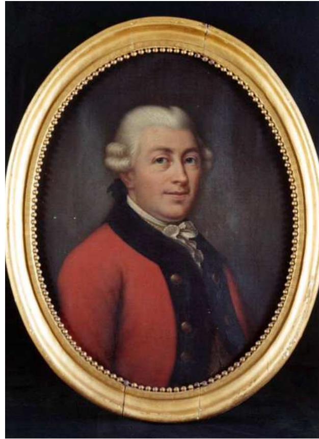
Carsten Niebuhr Preis für internationalen Kulturaustausch der Deutsch-Arabischen Gesellschaft

Wir bitten Sie um Ihre verbindliche Zusage bis spätestens zum 15.10.2022 per E-Mail unter info@d-a-g.de oder per Fax an 030 / 8094 1996, da wir hinsichtlich der Anzahl der Gäste disponieren müssen. Bitte auch den vollständigen Namen der Begleitperson(en) eintragen.