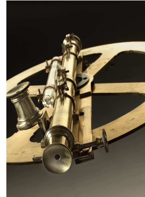
Astrolabium von Carsten Niebuhr

Veranstaltungsort: Irakische Botschaft Pacelliallee 19-21, 14195 Berlin