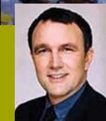
Dr. Michael Lüders

Humboldt Institut für Internet und Gesellschaft